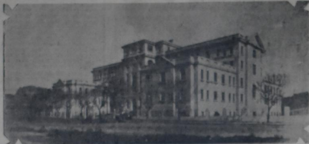
VISTA GENERAL DEL EDIFICIO DE FISIOTERAPIA Y RADIOLOGIA UBICADO EN EL Parque Centenario

Ala derecha. Sección hidroterapia con dos grandes salas para duchas, una sala de mecanoterapia y dos grandes terrazas iguales a las anteriores y para el mismo destino.