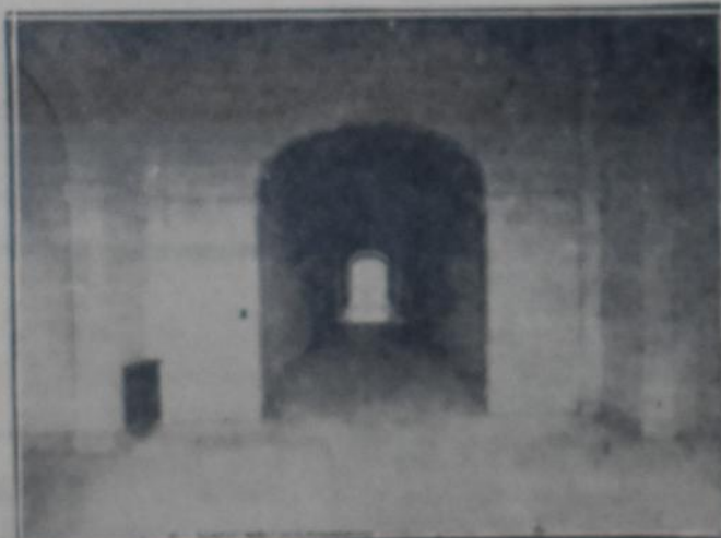
UNO DE LOS CORREDORES DEL ESTABLECIMIENTO